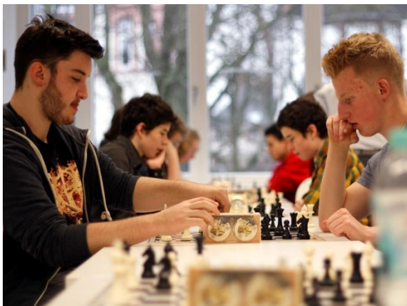
Blick in den Turniersaal