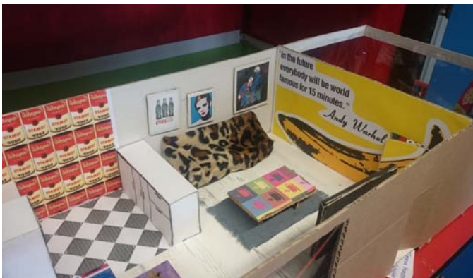
und Andy Warhol